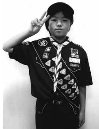
チャレンジ章をたくさん取得したカブスカウト

ビーバースカウト、カブスカウト、ボーイスカウト、そしてベンチャースカウト。それぞれの部門でその年代のスカウトにふさわしい様々なプログラムが用意されています。そしてその達成度を示すのが、数多くのバッジです。