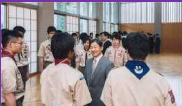
県連代表2名 東宮表敬訪問