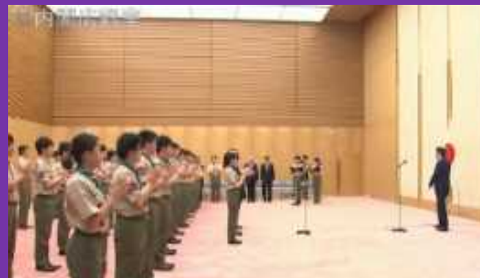
県連代表4名 首相官邸表敬訪問