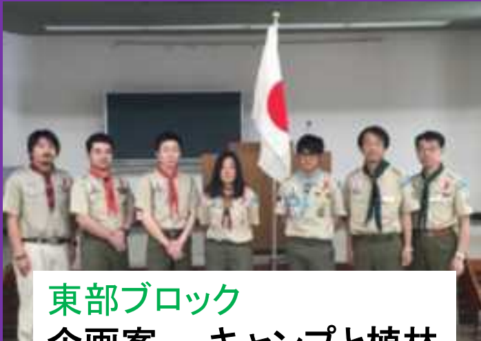
東部ブロック 企画案 キャンプと植林