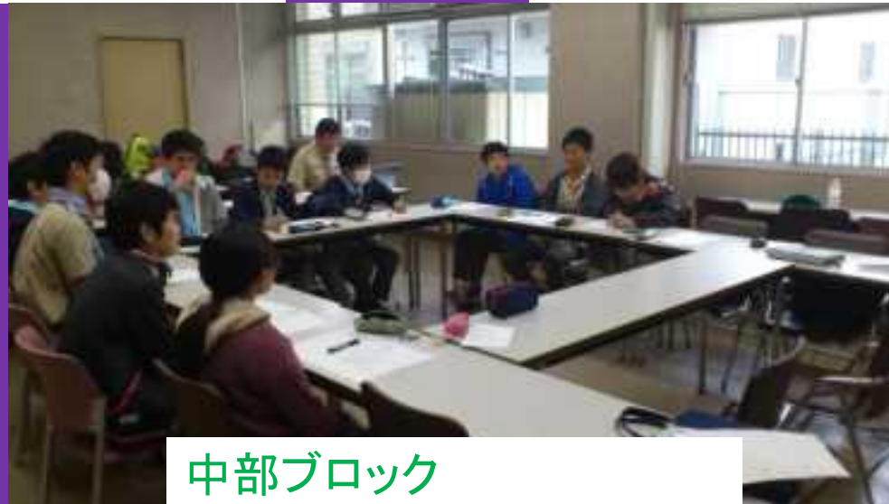
中部ブロック 企画案 超 野外キャンプ