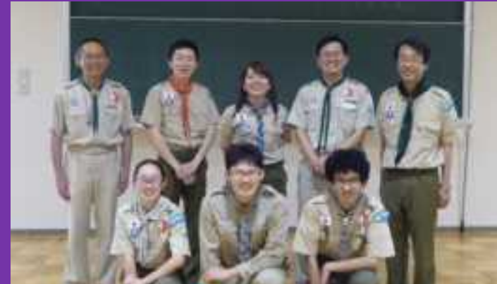
西部ブロック 企画案 スカウト人口を増やす！