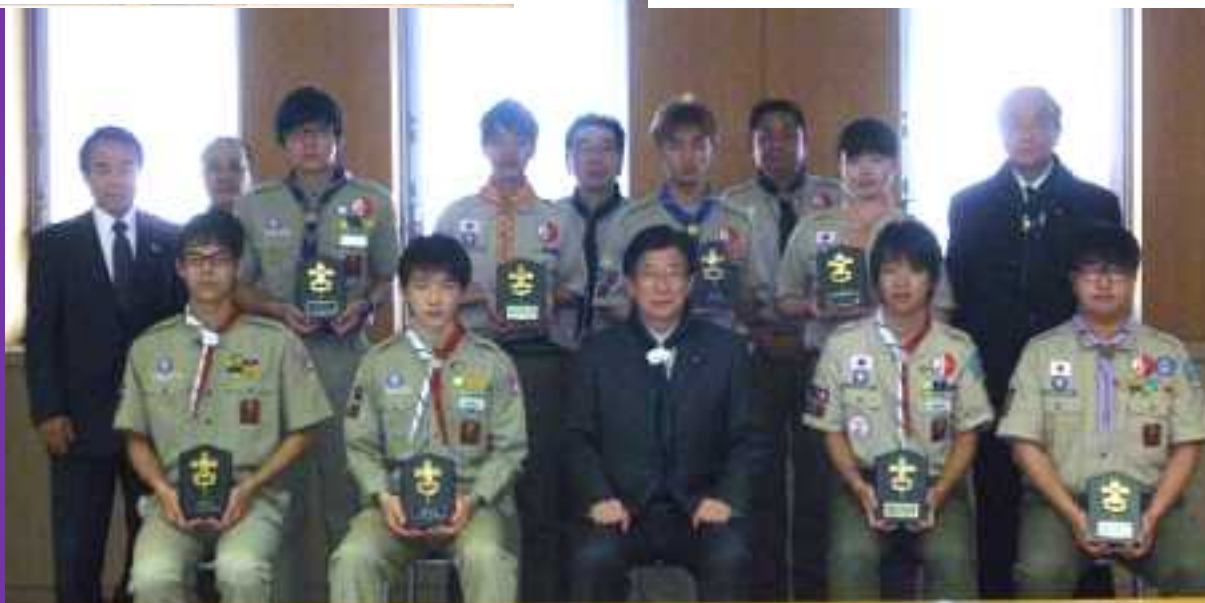
富士章受章スカウト県知事表敬訪問