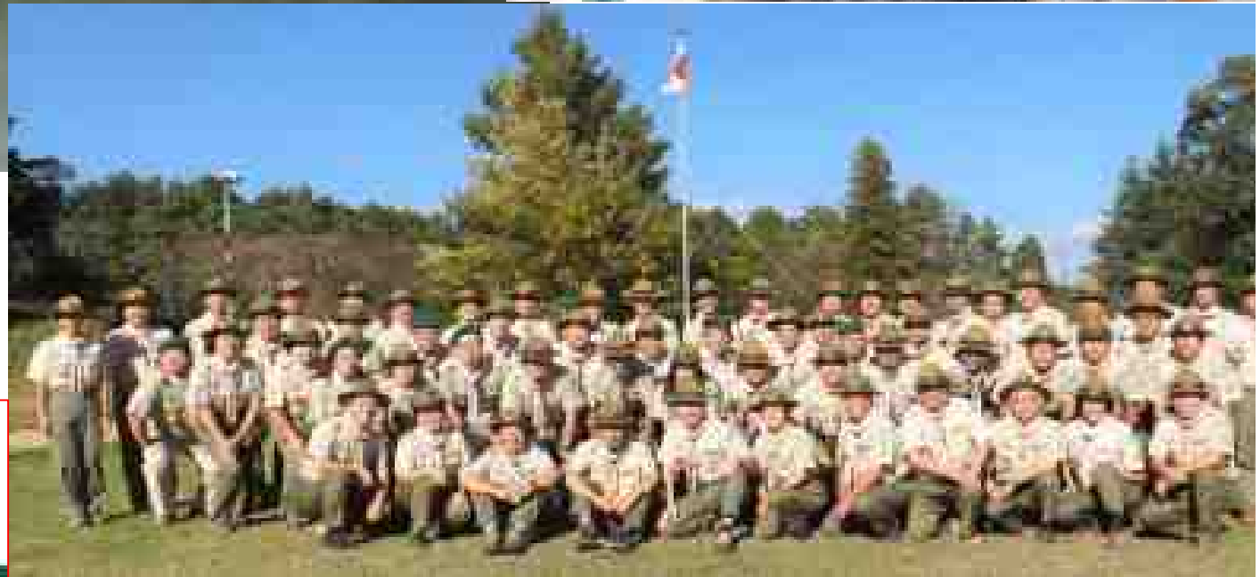
県T T研究集会第2回 11月5日～6日 国立中央青少年交流の家