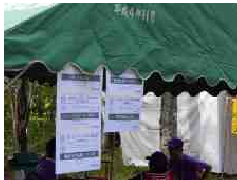
第3サブキャンプ (遠江) 静岡県連盟 西部ブロック