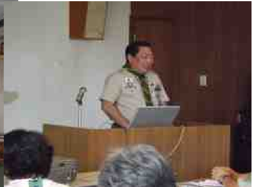
県T T研究集会第1回 6月19日 静岡県青少年会館