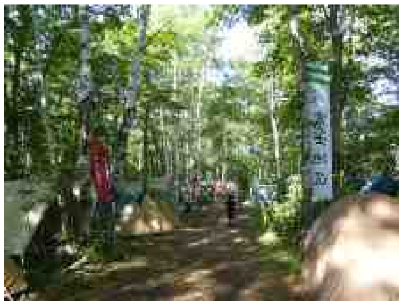
第2サブキャンプ (駿河) 静岡県連盟 東部・中部ブロック