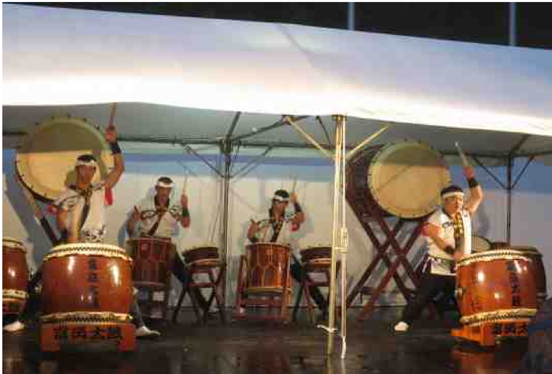
富岳太鼓の勇壮なステージ・ショー