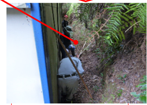
大ホール・倉庫 東面 水が流れない