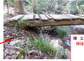
橋 土台流出補強(石置)