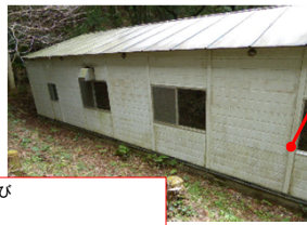
中ホール、壁面 かび