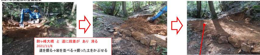
耐ヶ峰大橋と道に段差があり滑る 2021/11/8 道を掘る→岩を並べる→掘った土をかぶせる