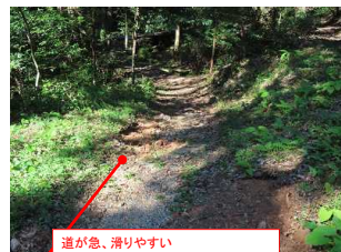
道が急、滑りやすい