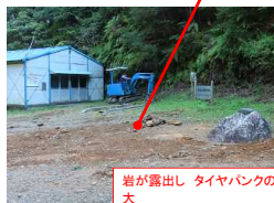
岩が露出し、タイヤパンクの可能性大 2021/10/28