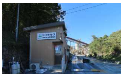
路盤整備用碎石購入 2021/10/28