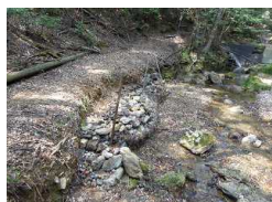
2021/10/30 路岸強化 (ユンボにて川の岩をリフト)