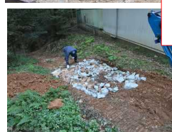
道を掘る ↓ 岩を入れる ↓ 碎石を入れる ↓ 掘った土をかぶせる ↓ ユンボで均す 2021/11/3 最上段 2021/11/6 第2段、第3段