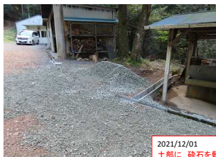
2021/12/01 土部に 砕石を敷き 安定化 →残り部分は 12/24に実施