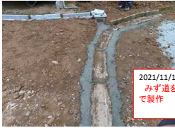
2021/11/19 みず道を コンクリート で製作