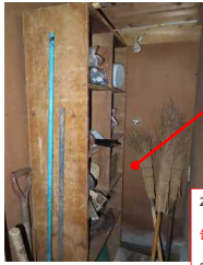
2021/11/19 風呂場最奥 残 塗料 缶 廃棄 2021/12/1 浜松地区倉庫内棚移 設