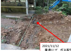
2021/11/12 業者にて ガス配管交