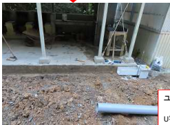
ユンボにて 掘削 U字溝、溜めます 設置