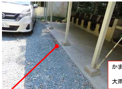
かまど 場 大雨時に 土砂が流れ込む