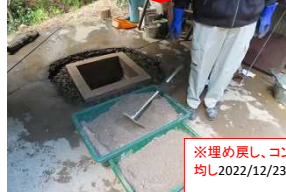
※埋め戻し、コンクリート均し 2022/12/23