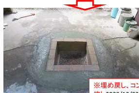
※埋め戻し、コンクリート均し 2022/12/23