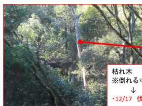
枯れ木 ※倒れる寸前 ↓ ・12/17 伐採