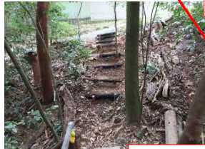
太田山広場 ←→いなに橋 ※階段完成