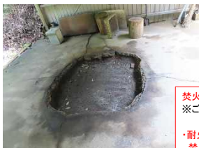
焚火場 ※ごみ焼き場 ↓ ・耐火煉瓦(ブロック)で囲い 焚火場 らしく 2022/12/27 完成