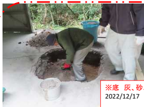
※底 灰、砂、土除去 2022/12/17