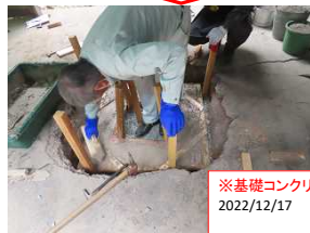
※基礎コンクリート打設 2022/12/17