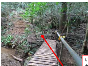
いなにベース ←→いなに橋 ※階段、土留め 完成