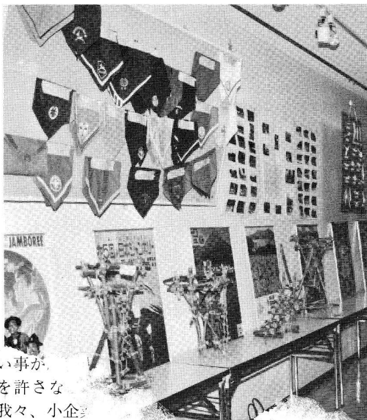
い事が、 を許さな 我々、小企

しかし別れても同じ浜松に活躍する同志として今後も互いに協力して共に発展出来るよう切磋琢磨してゆきたいものです。