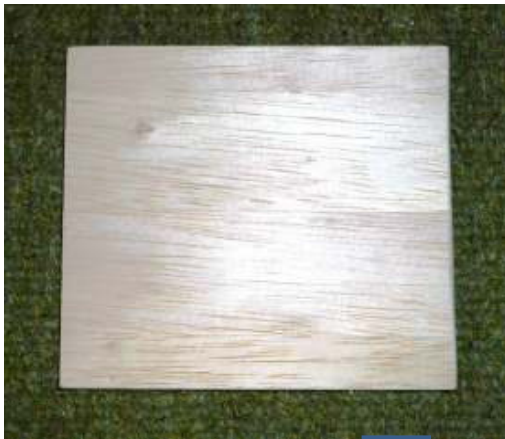
100×110mmの板 切り口を紙ヤスリで処理